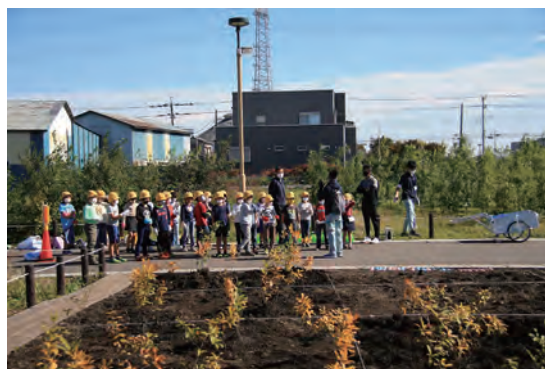
植樹手順についてのレクチャー

植樹前にはスタッフから、過去に植樹を行った苗木を前に、どんぐりの実から苗木がどんなふう成長していくかについてレクチャーがありました。2年前に植樹された苗木は、成長の良い木では、2m近くもあります。自分たちで植えた苗木が、どこまで成長するか、楽しみですね！