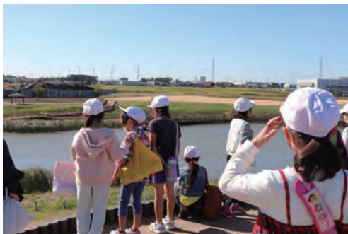
築山の上から眺めを楽しむ子供たち

植樹の後は、開園して間もない園内をみんなで散策！築山に登ったり、水辺に近づける橋を通過して、園内を歩きました。築山からは園内を一望できます。みんなで植えた苗木が森になっていく様子も見られます。木の成長を見にぜひまた遊びに来てね！