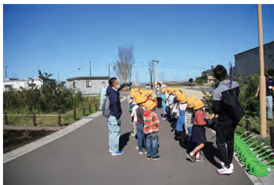
苗木の成長についてのレクチャー