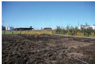
今回植樹したエリア