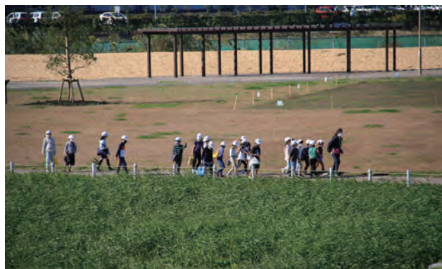
みんなで公園内を散策の様子