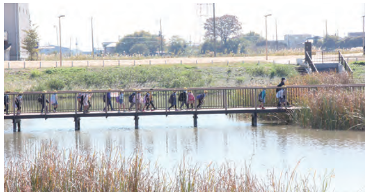
みんなで公園内を散策する様子