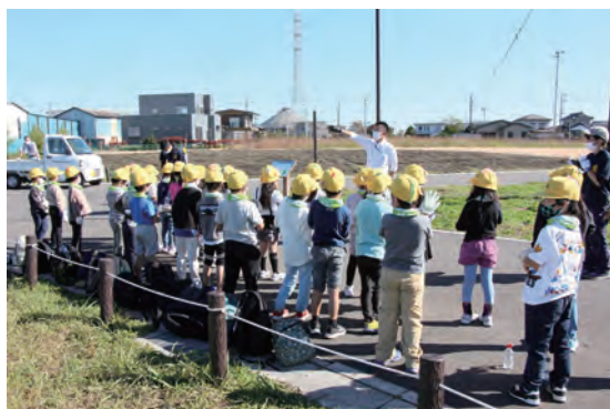
苗木の成長についてのレクチャー