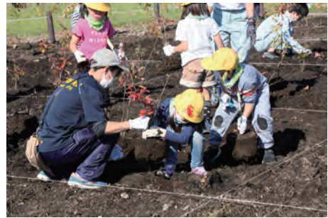
掘った穴に苗木を運ぶ様子

植えられた苗木は、子どもたちが中学生になるころには右の写真のポール（高さ 5m）くらいまで成長するそうです。