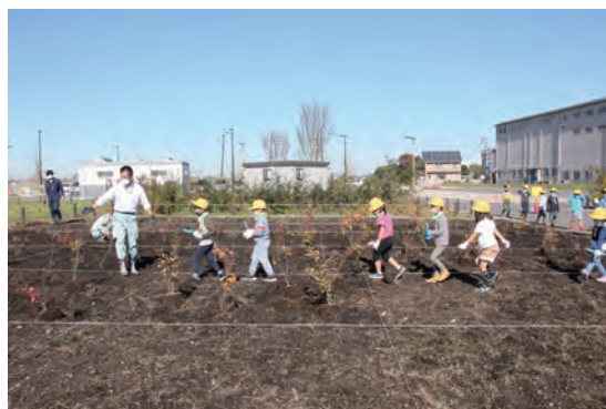
植樹場所に移動する様子

植樹前にはスタッフから、どんぐりの実から苗木がどんなふう成長していくかについてレクチャーがありました。3年後の苗木の成長目標は高さ 2m。子供たちは、植樹した苗木の成長目標を示したポールと、自分たちの身長を比べて、樹木の成長を体感していました。自分たちで植えた苗木が、どこまで成長するか、楽しみですね！