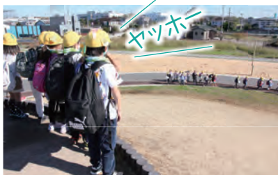
築山の上から呼びかけ合う子供たち

植樹の後は、公園内をみんなで散策！特に、築山の上からの公園の眺めは最高です！園路を歩いているお友達に、山頂から“やっほー！！”と大きな声で呼びかけ、やまびこのように呼びかけ合って楽しみました。園路には、案内してくれるかのようにハクセキレイが歩いていました。また池周辺にはオオバン、ヒドリガモ等も見られ、子どもたちを待っていたかのようなのでした。