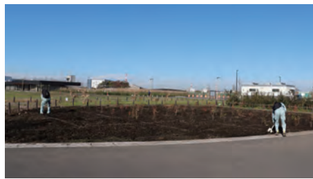
今回植樹したエリア

植えられた苗木は、子どもたちが中学生になるころには右の写真のポール（高さ 5m）くらいまで成長するそうです。