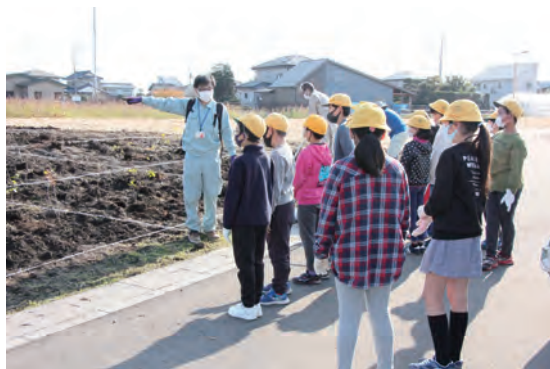
植樹手順についてのレクチャー