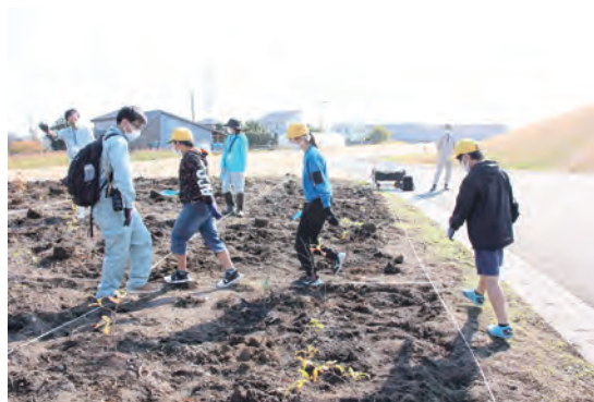
植樹場所へ移動する様子

🍃 スタッフから、1 年前、2 年前に植えられた木をそれぞれ紹介されました。2 年も経つと成長の良い木は 2m 近くになるそうです！その後、植樹の手順についてレクチャーがありました。これから自分たちが植えていく苗木を見ながら、子どもたちは真剣な様子でスタッフの説明を聞きました。軍手をはめ、移植ごてを持ったら、いよいよ植樹していきます！