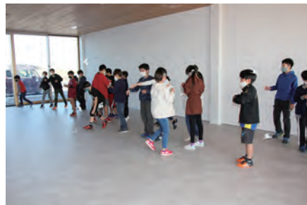
作ったコガモを飛ばしている様子

公園の管理棟では、「身近な生き物」について環境学習が行われました。地球上には、まだ見つかっていない種も含めてなんと、約 3,000 万種の生き物が存在するそうです！人間だけでなく、いろんな生き物が一緒に暮らしていくには、人間の行動がとても重要ということを学びました。環境学習の後半は、厚紙でコガモを作り、みんなで飛ばして遊びました！よく飛んだでしょうか？