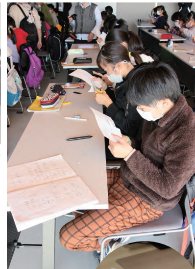
厚紙からコガモを作る様子

公園の管理棟では、「身近な生き物」について環境学習が行われました。地球上には、まだ見つかっていない種も含めてなんと、約 3,000 万種の生き物が存在するそうです！人間だけでなく、いろんな生き物が一緒に暮らしていくには、人間の行動がとても重要ということを学びました。環境学習の後半は、厚紙でコガモを作り、みんなで飛ばして遊びました！よく飛んだでしょうか？